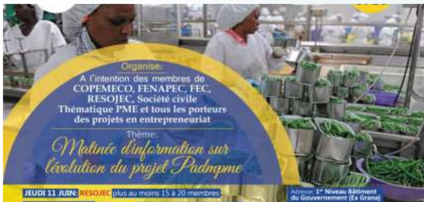
L'affiche de la matinée d'information organisée à Lubumbashi

Où en est-on avec l'exécution du PADMPME? La question revient sur toutes les lèvres et partout au sein de l'écosystème des MPME aussi bien à Kinshasa que dans les villes de Goma, Lubumbashi et Matadi.